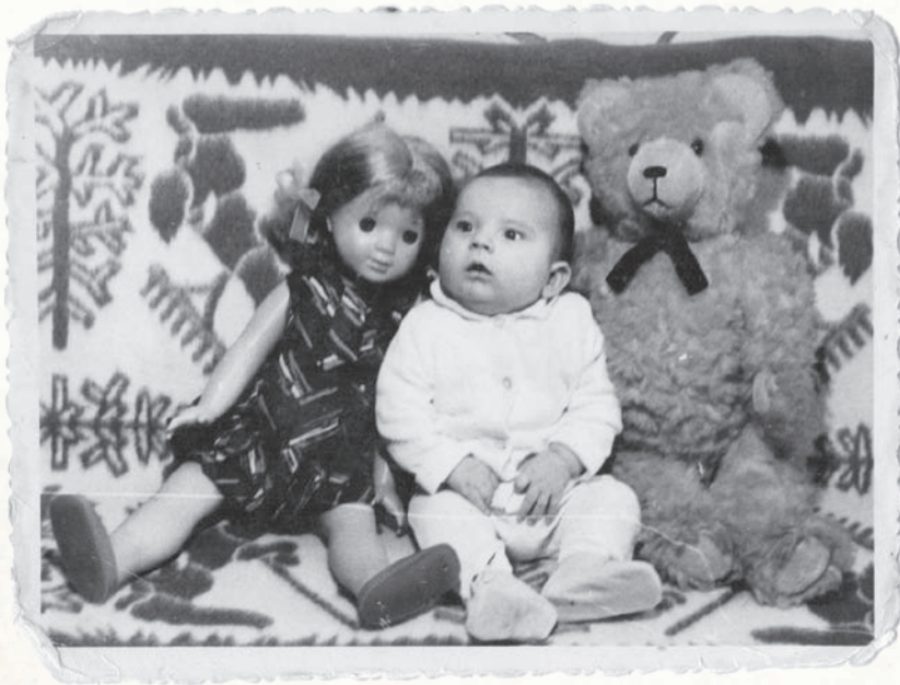
3,5 місяці. Сусиди підтфилуєть.