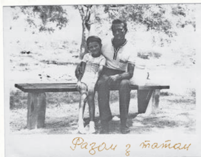
Разом з татом