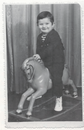
Офортний коник. 3 роки